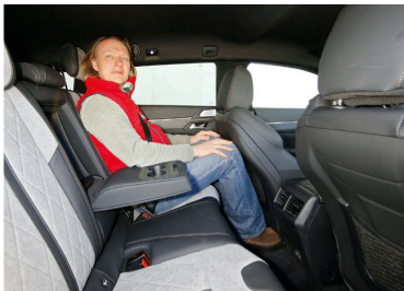
▲ Kurze und flache Sitze, knapper Knie- und Fußraum und ein beengter Einstieg enttäuschen im Peugeot

Genießer werden hingegen den Peugeot-Antrieb zu schätzen wissen. Leise summt er dahin, das Zuschalten des Verbrenners geschieht fast unmerklich. Gerade im Stadtbetrieb kann er seine zwei zusätzlichen Fahrstufen, die sich zudem sanft und nervenschonend via Wandler abwechseln, voll gegenüber dem deutlich ruppigeren Sechsgang-DSG des Skoda ausspielen. Der fährt zwar gefühlter im reinen E-Modus, die Messwerte sprechen aber eine andere Sprache. Bündelt er jedoch seine